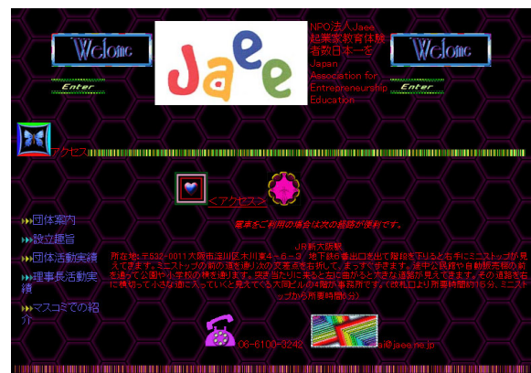
図1. ビル名を探しにくい不快なWebページ

この結果、図1のWebページに関しては10名の被験者全員が文字が見にくく不快・または非常に情報を探しにくいと答えた。図2のWebページは全員