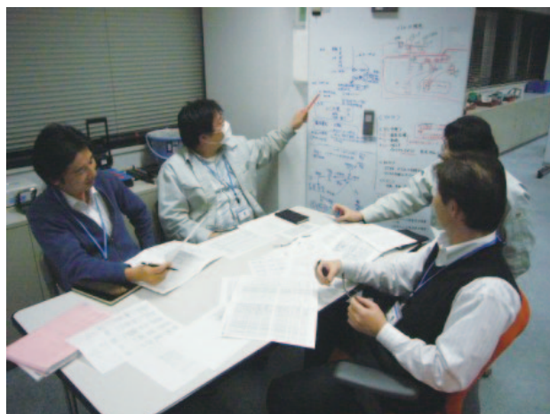
図-1 ソフトウェアレビュー／ソフトウェアインスペクション会議の様子

ソフトウェアレビュー／ソフトウェアインスペクションの歴史は古く、1976年にFaganが“Design and code inspections to reduce errors in program development” 3)